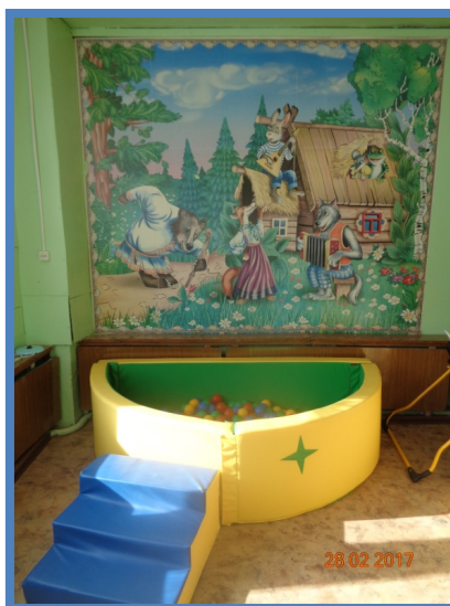
Таблица № 3