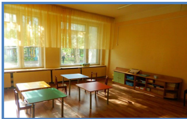
Таблица № 1