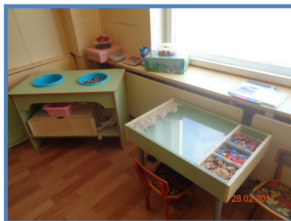
Таблица № 2