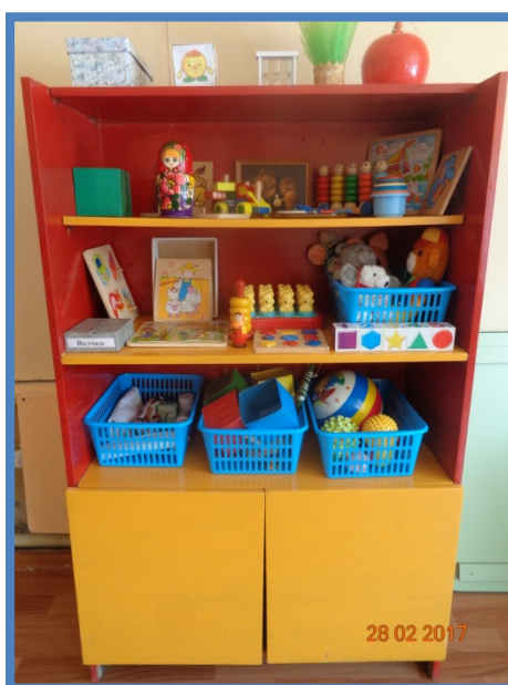
Таблица № 4 Каталог методической