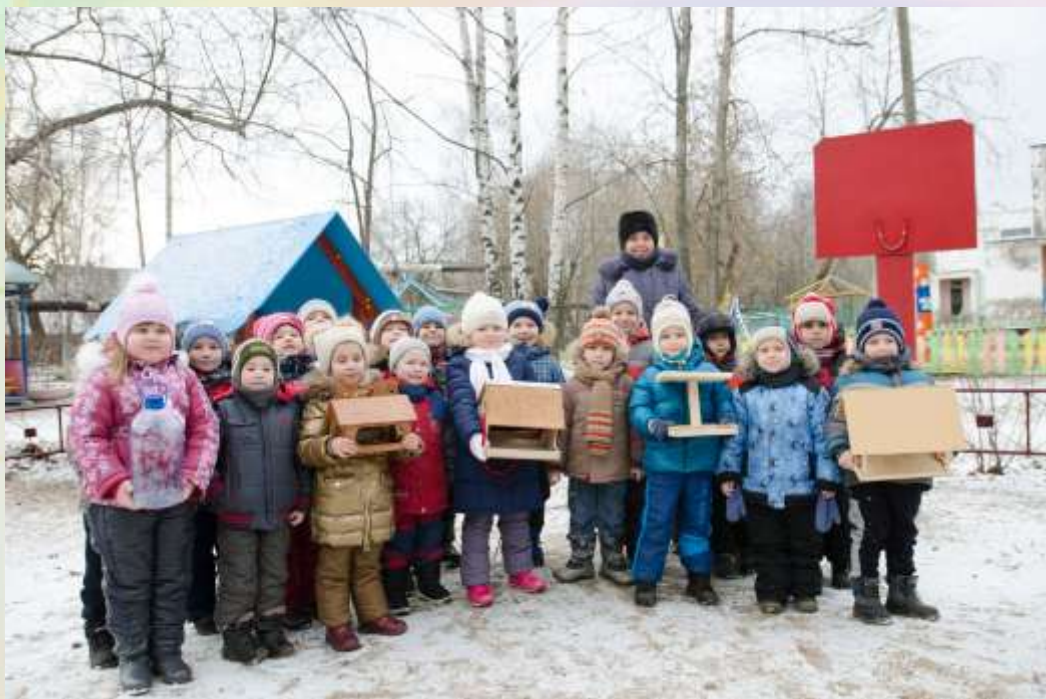
Лучшая кормушка для птиц

В нашем детском саду регулярно проводятся внутренние конкурсы, выставки детского творчества, спортивные мероприятия. Детям очень приятно видеть собственные работы на выставках, а также ребята с большим любопытством рассматривают поделки других детей.