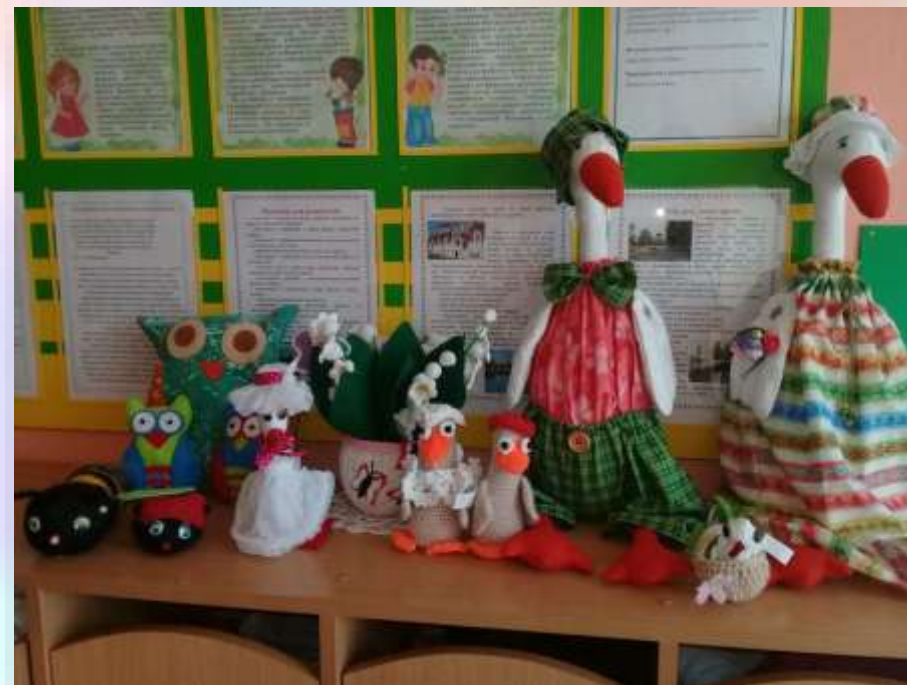
День Никиты- гусятника